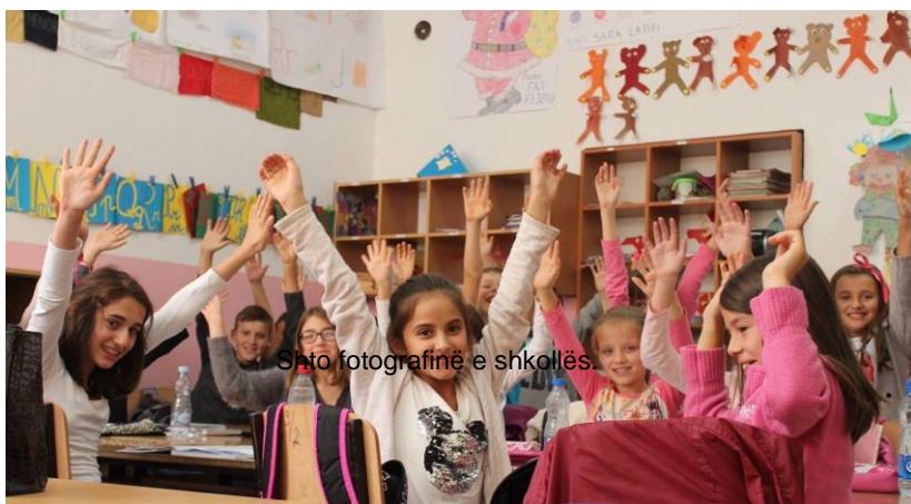
Sho fotografinë e shkollës.