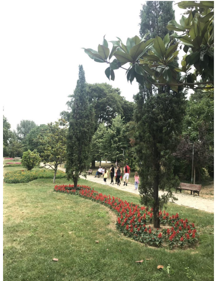
Mirëmbajtja e parqeve të qytetit nga NPK "Hortikultura".