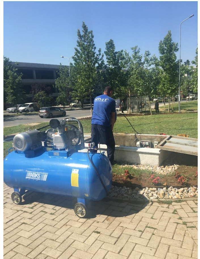
Shpimi i puseve dhe pastrimi i tyre për mirëmbajtjen e parqeve;