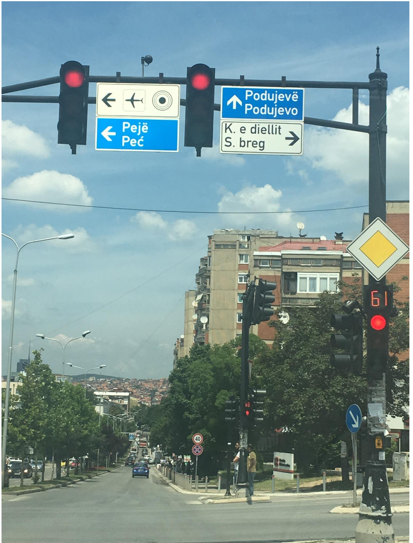
Mirëmbajtja e semaforëve.