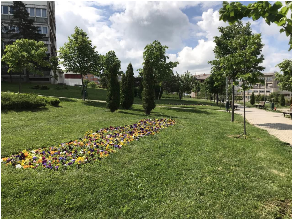
Mirëmbajtja e parqeve të qytetit nga NPK "Hortikultura".