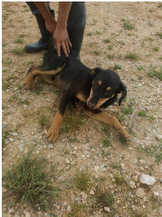
Trajtimi i qenve endacakë në komunën e Prishtinës.