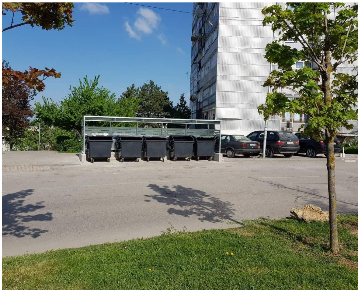
Mirëmbajtja dhe pastrimi i mbeturinave në qytet dhe hapësira publike.