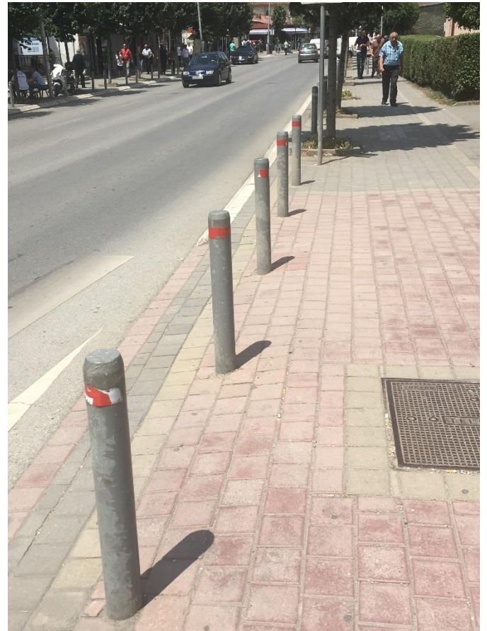
Mirëmbajtja dhe vendosja e shtyllave antiparking.