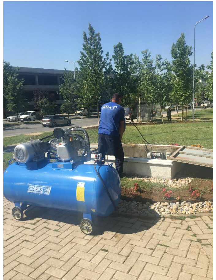
Shpimi i puseve dhe pastrimi i tyre për mirëmbajtjen e parqeve;