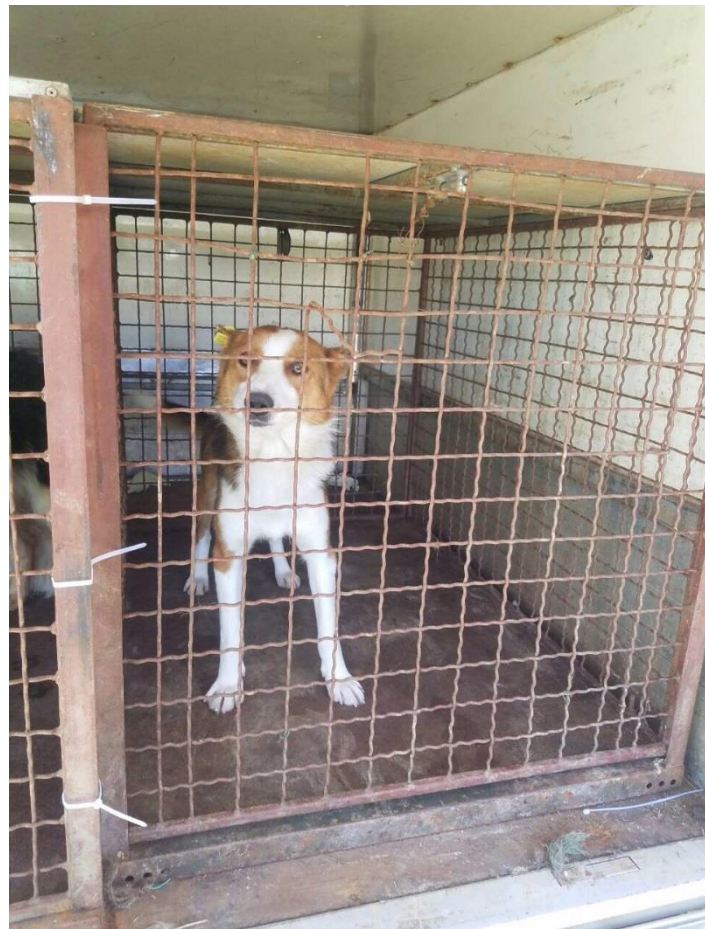
Trajtimi i qenve endacakë