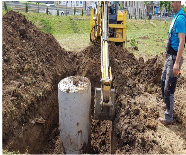
Shpimi i puseve dhe montimi i pompave për puse