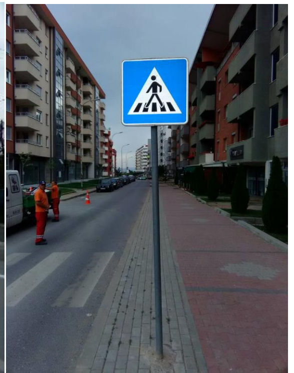
Sinjalizimi vertikal dhe horizontal në Komunën e Prishtinës