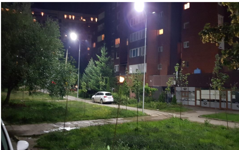
Mirëmbajtja, zgjerimi dhe modernizimi i ndriçimit publik në Prishtinë