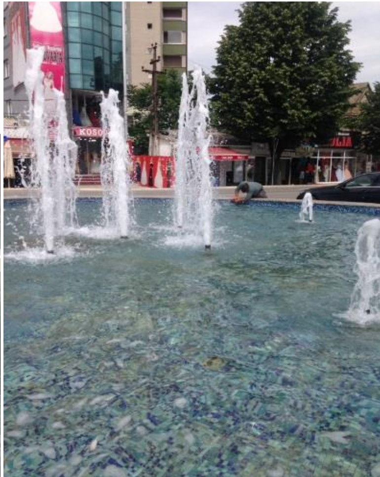
Mirëmbajtja e fontanave dhe krojeve