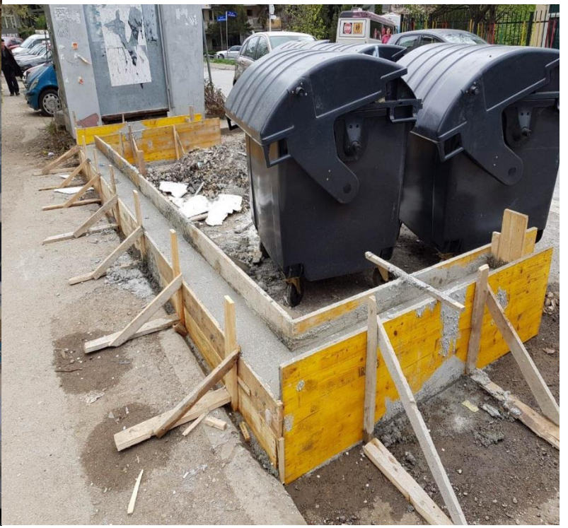
Mirëmbajtja dhe pastrimi i mbeturinave në qytet dhe rregullimi i hapësirave për vendosjen e kontejnerëve.