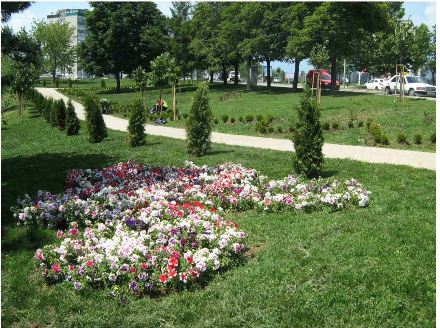
Mirëmbajtja e hapësirave publike dhe parqeve