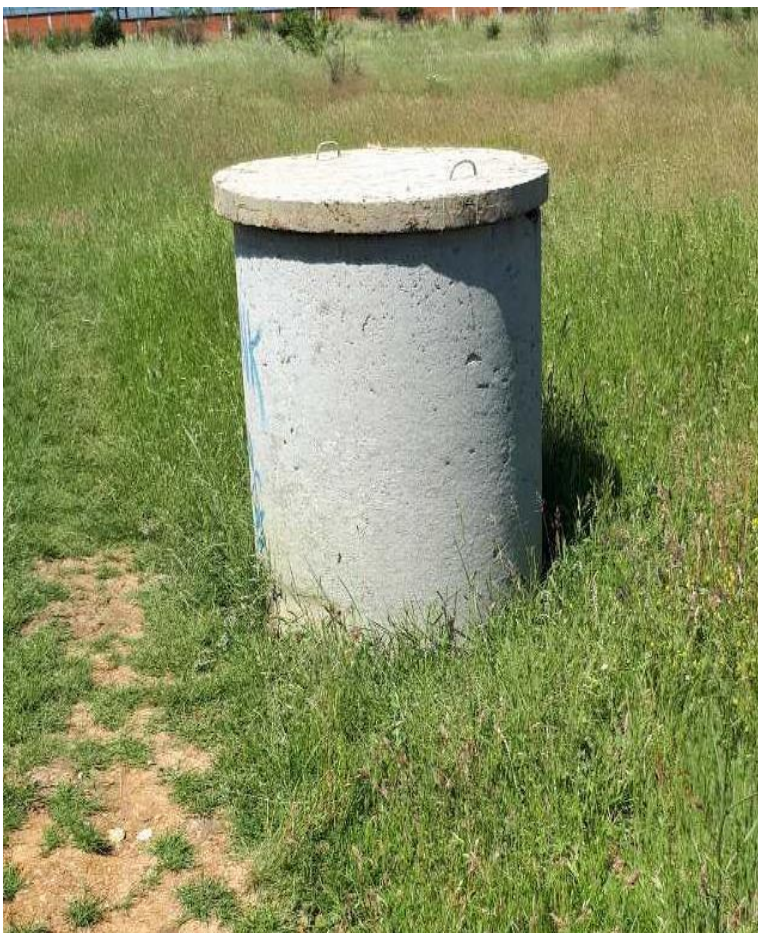
Intervenimet e ekipeve të emergjencës për identifikimin dhe mbulimin e puseve.