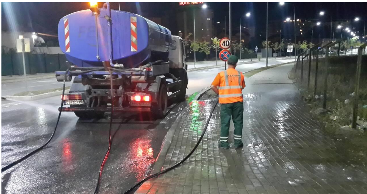
Pastrimi dhe mirëmbajtja e rrugëve dhe pusetave të ujërave atmosferike