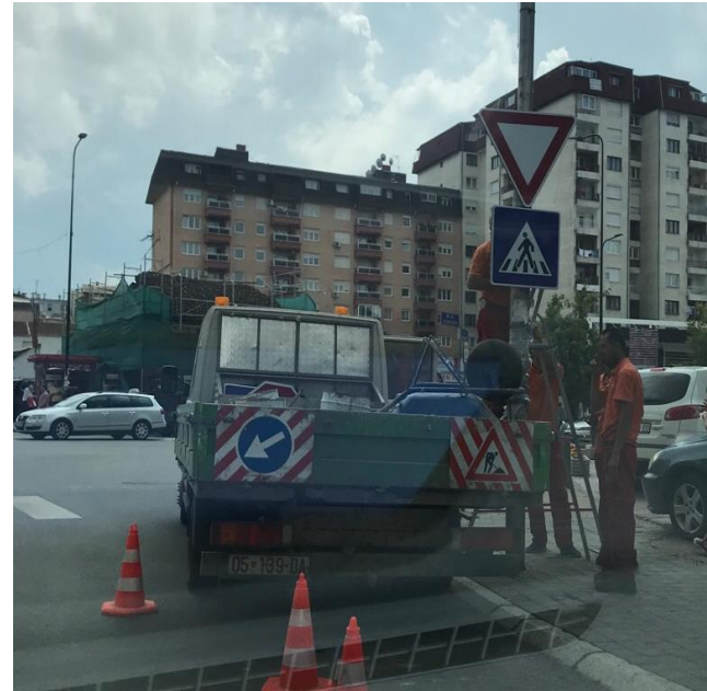
Furnizimi dhe vendosja e shtyllave antiparking për lirimin e hapësirave publike, rregullimi dhe mirëmbajtja e shenjave të komunikacionit