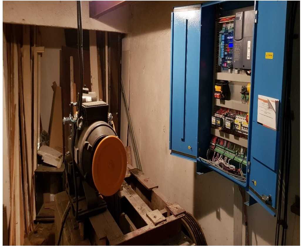
Rregullimi dhe mirëmbajtja e ashensorëve