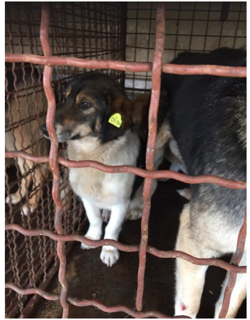
Trajtimi i qenve endacakë në komunën e Prishtinës nga kompania kontraktuese