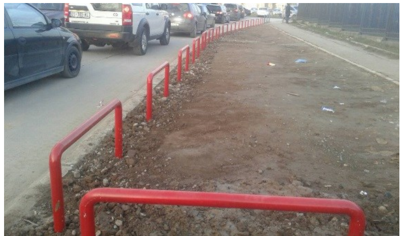
Punimi, furnizimi dhe montimi i shtyllave antipark dhe shtylla lëvizëse.