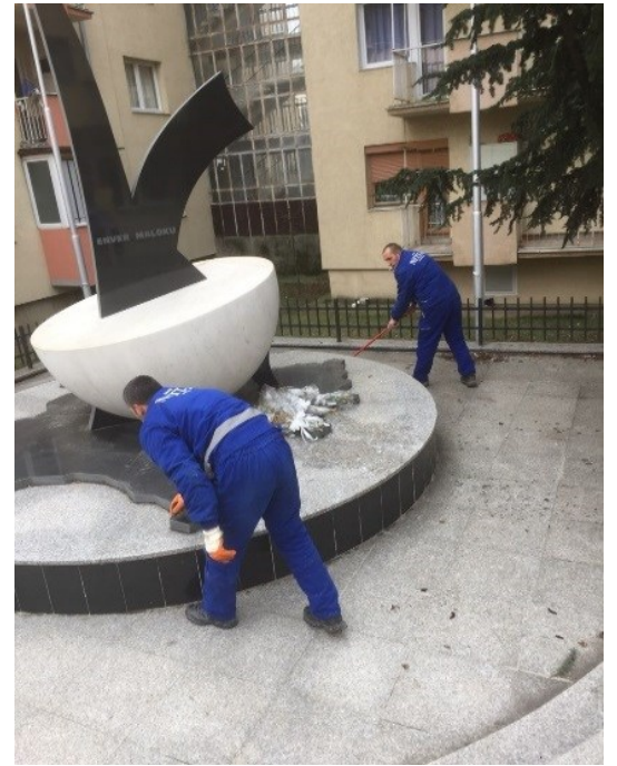
Mirëmbajtja e fontanave nga kompania kontraktuese