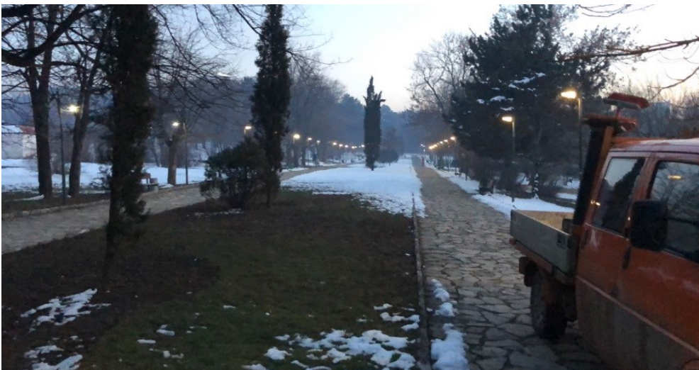
Mirëmbajtja e ndriçimit publik nga kompania kontraktuese