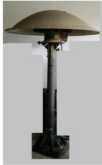
Testimi i sistemit të alarmimit publik me zë, më 03.02.2018

RREZIK NGA AJRI - Sinjali i alarmimit rrezik nga ajri është: 60 sekonda zë valorë pa ndërprerë.