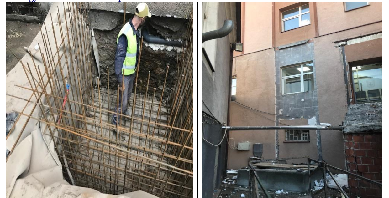
Foto gjatë ekzekutimit të punimeve