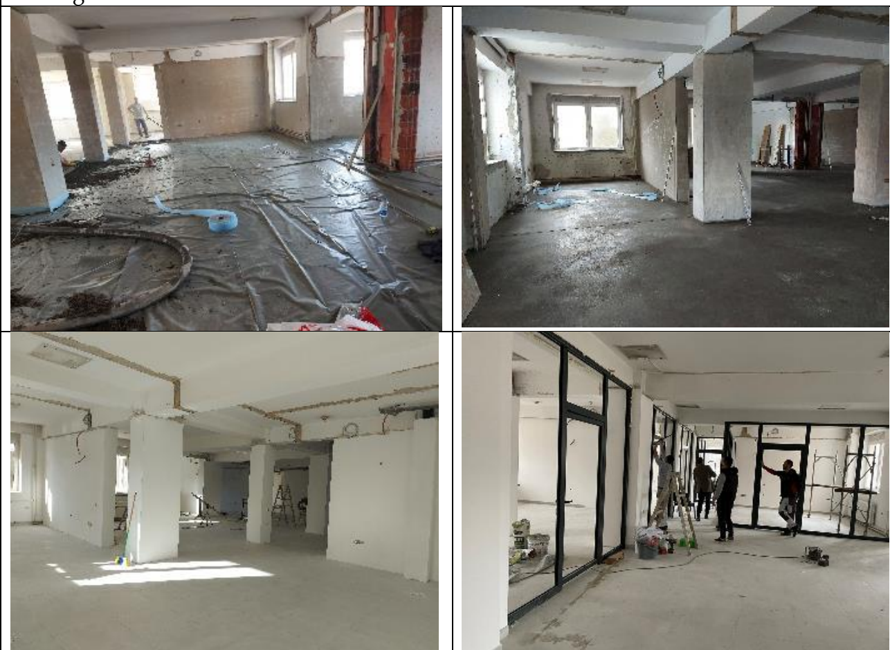
Foto nga tereni