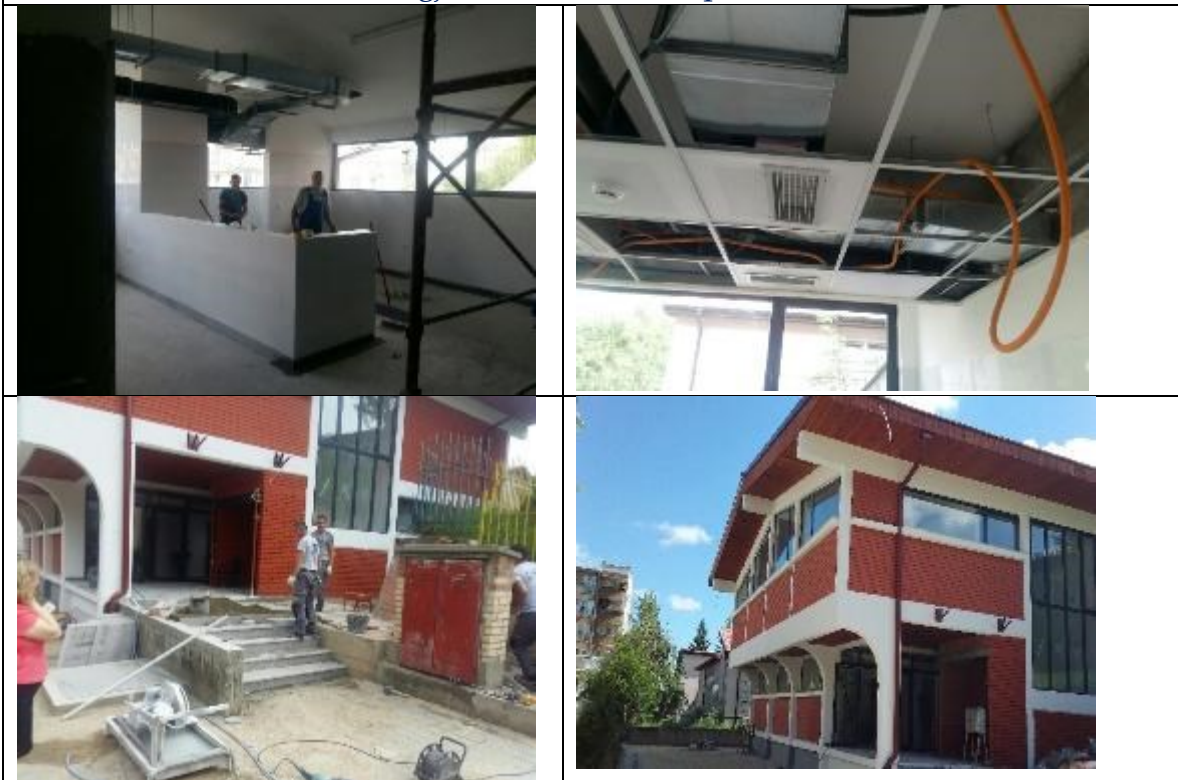
Foto gjatë ekzekutimit të punimeve

Nr. i kontratës dhe data. Nr. 616 16 124 521 dt. 19.10.2016